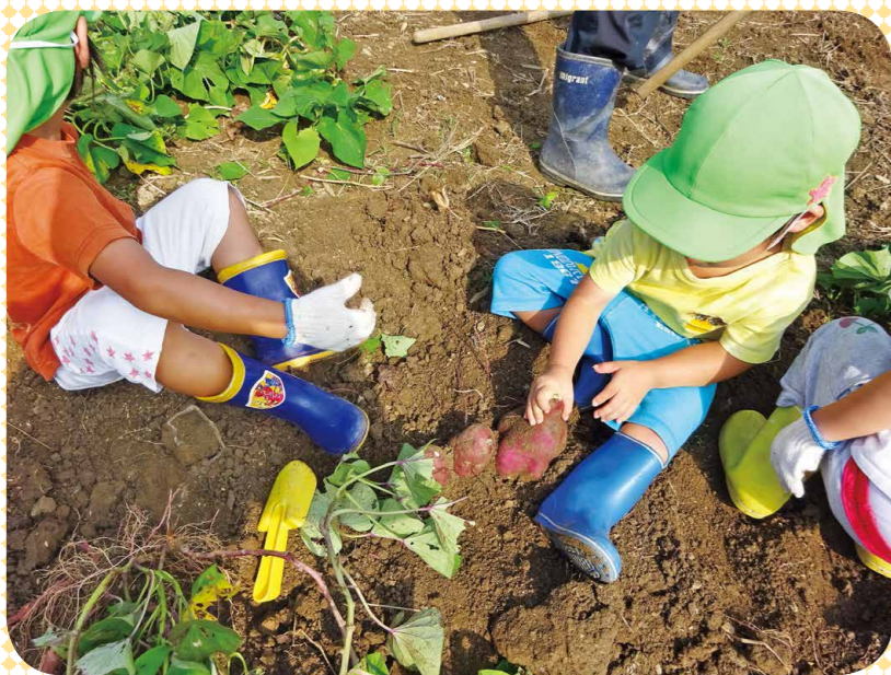
10月、お野菜とさつまいもをとりにいきました！