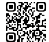
里親ページはこちら！

講習のご希望は、日本赤十字社徳島県支部 (Tel088-631-6000) まで