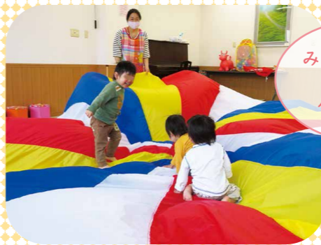
みんな大好き！ パオパオ バルーン♪