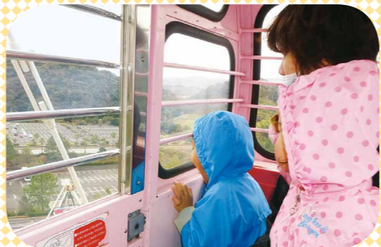
11月、動物園と遊園地であそんだよ はじめての観覧車、すこしこわかった