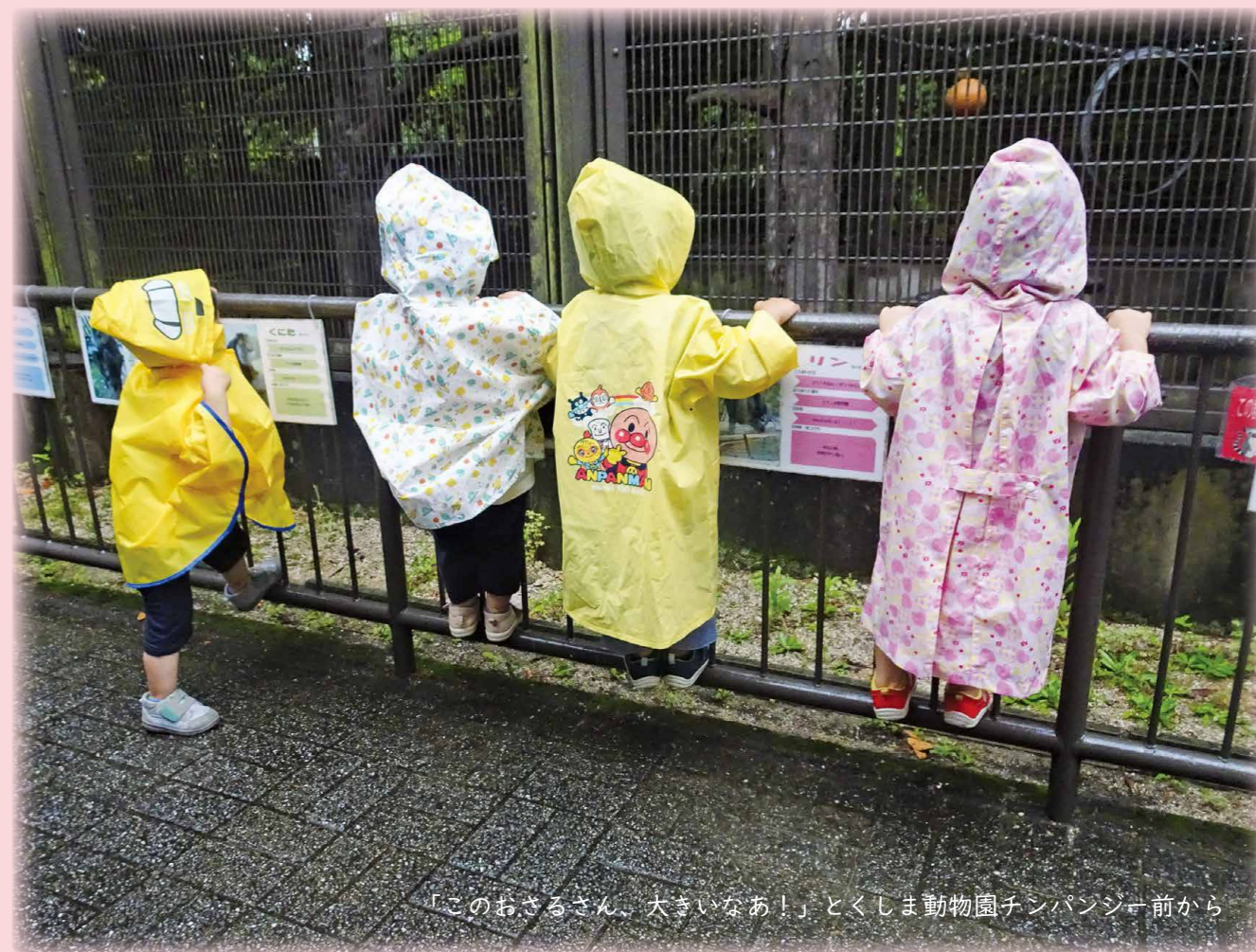
「このおさるさん、大きいなあ！」とくしま動物園チンパンジー前から

子育ての専門スタッフが、24時間体制で乳幼児を養育している徳島県内唯一の施設です