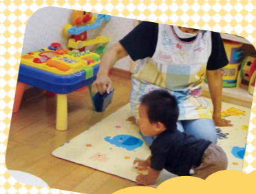
LINE面会。 元気よく動くので追 かけるのに一苦労 (*_*)