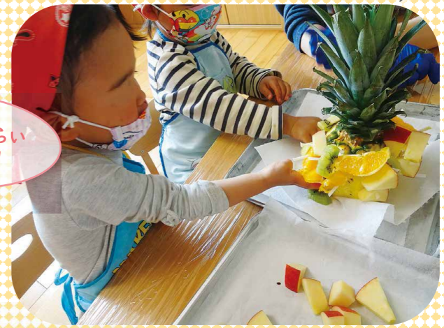
パイナップルタワー