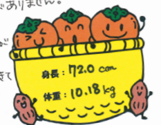
重さ: 172.0g 体積: 10.18kg

名前を呼ぶと可愛い笑顔と返ってくる... 9月21日 床に落ちたおもちゃを拾って できるおにぎりを作りました。食べているうちに おにぎりがおにぎりになってしまいました。9月21日 10月に入ると8時、10時と夜間保育が増え 今日は10時と夜間保育が増え 食事はおにぎりとバナナが おにぎりは9時～10時 食卓はママもパパも よく食べていることができて います。ママとパパと 遊ぶこともできます。 （パパとママと手を繋いで） 「ママとパパと手を繋いで」 甘えて泣いてしまうこともありますが、抱っこすると、 すぐに笑顔になります。